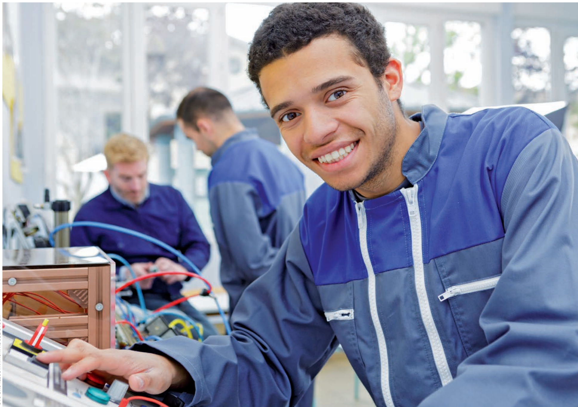
Im Betrieb oft unverzichtbar: Ohne die ausländischen Kollegen wäre die Fachkräfte-Lücke noch viel größer.

Arbeitsmarkt Der Südwesten braucht besonders viele MINT-Spezialisten – und findet nicht genug. Jetzt gilt ein neues Einwanderungsgesetz: Was bringt es den Betrieben?